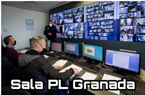
Sala PL Granada

Cuando publicamos esta imagen en RRSS nos escribió un compañero de Pamplona creyendo que la foto de Sevilla era un montaje porque no se creía que una ciudad como Sevilla tuviera esa sala de control, desgraciadamente le tuvimos que decir que no era un montaje, que esta era la realidad de Sevilla, con una policía local ABANDONADA por sus dirigentes políticos