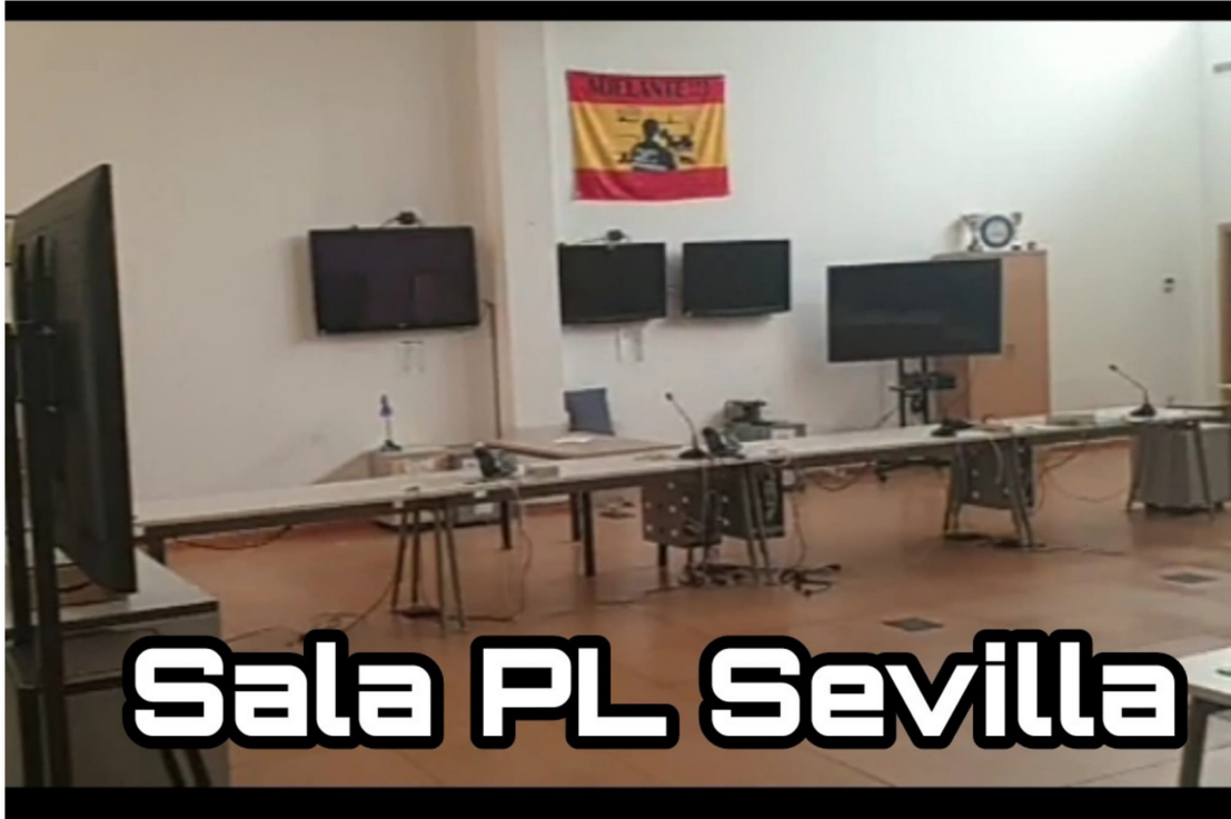
Sala PL Sevilla