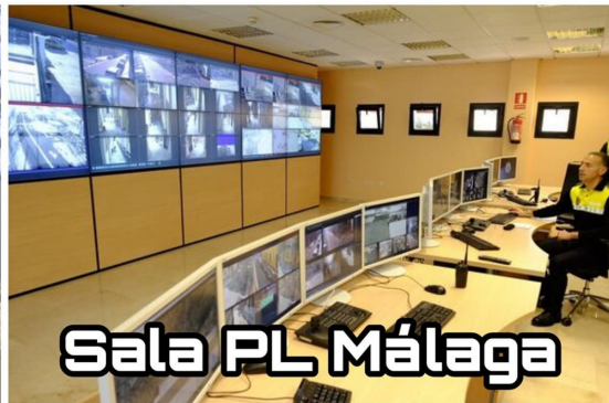
Sala PL Málaga